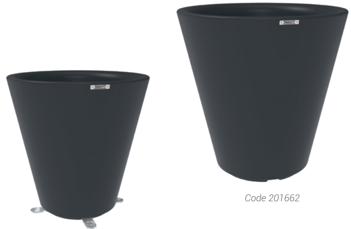
Code 201661 + 201669